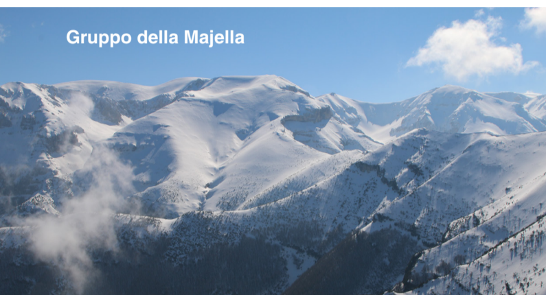
Gruppo della Majella