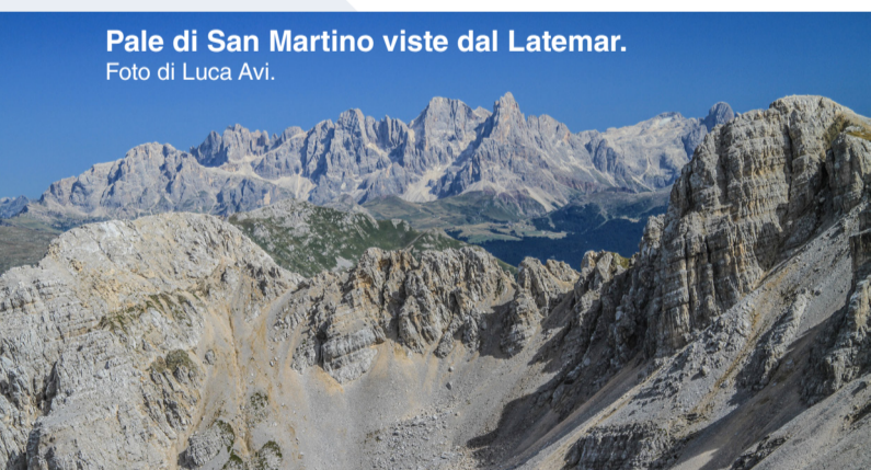
Pale di San Martino viste dal Latemar.