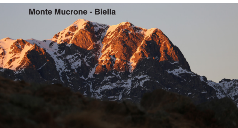
Monte Mucrone - Biella